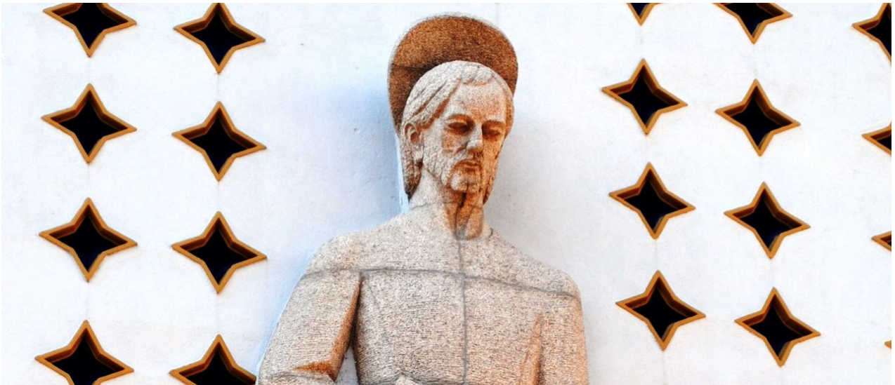
'San Xosé Obreiro' (1964).